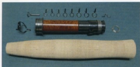
Kit n. 3 Tich single foot guides Ponte singolo in Tich