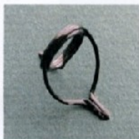
BL57 Sizes 10-12-16 Misura 10-12-16