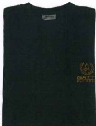
AB07 Size M-L-XL-XXL