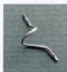
BL15 Sizes 1-2-3-4-5 Misura 1-2-3-4-5