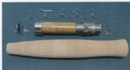
Kit n. 1 Hard Chrome snake guides Serpentine in cromo