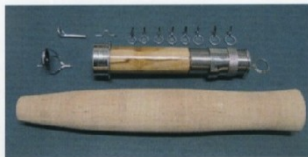
Kit n. 2 Hard Chrome single foot guides Ponte singolo in cromo