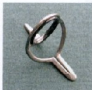
BL38 Sizes 10-12-16 Misura 10-12-16