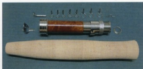
Kit n. 5 Nikel silver single foot guides Ponte singolo nikel silver