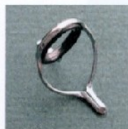
BL35 Sizes 10-12-16 Misura 10-12-16