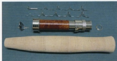
Kit n. 4 Nikel silver snake guides Serpentine nikel silver