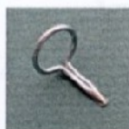
BL11 Sizes 1-2-3-4-5 Misura 1-2-3-4-5