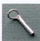
BL13 Sizes 5x1,6-1,8-2-2,2 Misura 5x1,6-1,8-2-2,2