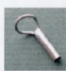
BL54 Sizes 7x2-2,2-2,4-2,6 Misura 7x2-2,2-2,4-2,6